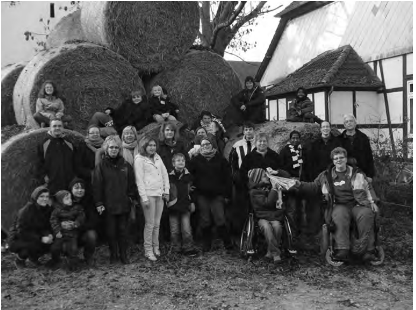
Begegnungs- und Erlebniswochenende für Familien mit behinderten und nicht behinderten Kindern im November 2011 in Hevensen/Landkreis Northeim