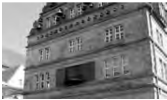
Das Glockenspielhaus in Hameln, der Rattenfängerstadt

Es gibt viele Einschränkungen, die eine Stadtführung sehr schwierig machen. Ein Rollstuhl, eine Sehbehinderung oder Blindheit oder ein stark eingeschränktes Hörvermögen bis hin zur Taubheit. Um Menschen mit einer solchen Behinderung dennoch eine erlebnisreiche Stadtführung zu bieten, hat sich Hameln etwas einfallen lassen. Niedersachsens Rattenfängerstadt bietet Stadtführungen in Gebärdensprache sowie Gästeführungen für Blinde und Mobilitätseingeschränkte. Verantwortlich für dieses Angebot für Reisende mit Handicap ist die Tourist-Information Hameln.